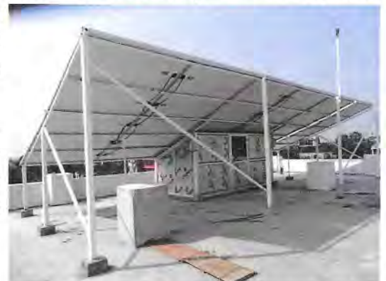
Solaranlage auf dem Neubau

Natürlich war nicht immer alles einfach, die vielen Regierungswechsel seit der Gründung der Demokratie im Jahr 2008, die unsägliche Bürokratie im Staat und die Korruption in der Beamtenschaft haben uns immer wieder behindert. Auch die vorherrschende Hierarchie in der nepalesischen Kultur sorgt für grosse Ungerechtigkeit und Missstände, indem oft unfähige Leute wichtige Posten besetzen, für welche es weit bessere KandidatInnen gegeben hätte. All dies ist auch ein wichtiger Grund, wieso Nepal mit seinem grossen Potential, immer noch zu den zehn ärmsten Ländern der Welt gehört. Trotz allem lassen wir uns nie entmutigen und dank des grossen Netzwerks von Shanti Med Nepal und viel Unterstützung durch lokale Persönlichkeiten, konnten wir auch im Jahr 2018 wieder viele Anliegen verwirklichen und voranbringen.