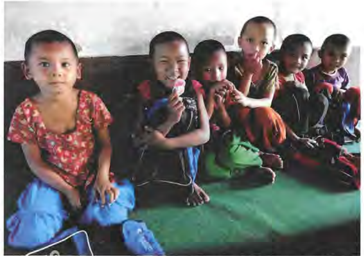
Kinder der Antyodaya Schule

Das 10. Jahr: «Shanti Med Nepal» kann dieses Jahr das erste runde Jubiläum feiern. Dank der grossen finanziellen Unterstützung von zahlreichen Mitgliedern, SpenderInnen und Stiftungen, sowie der tatkräftigen Mithilfe von vielen VolontärInnen, konnten wir die medizinische Unterstützung für die bedürftigen Menschen in Nepal regelmässig ausbauen und vielen Menschen bessere Lebensperspektiven ermöglichen. Dies haben wir vor allem mit der medizinischen Hilfe erreicht, aber auch mit der Versorgung mit Lebensmitteln und Kleidern nach dem schweren Erdbeben und den Überschwemmungen, oder durch Unterstützung von Kindern für ihren